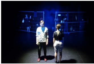
Auftritt bei der Schultheaterwoche Braunschweig