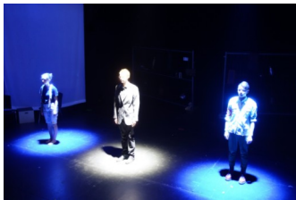
Auftritt letzte Aufführung „Warten“