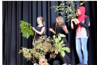
Auftritt beim Schulfest